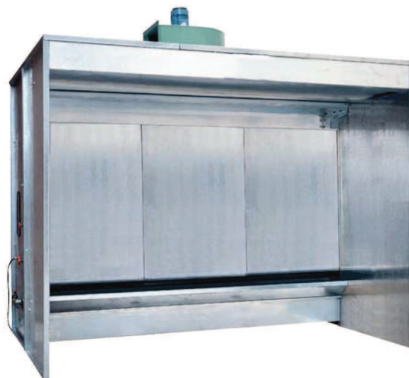
SULTRAG RIDEAU D'EAU - AVEC AVANCEE

Fronte aspirante con pareti prolungate, tetto.